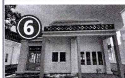
6 ขนาดพื้นที่ทั้งหมด 47.7 ตารางเมตร