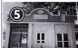
5 ขนาดพื้นที่ทั้งหมด 47.7 ตารางเมตร