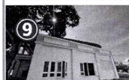
9 ขนาดพื้นที่ทั้งหมด 54 ตารางเมตร

กองบริหารงานทรัพย์สินและกิจการพิเศษ มหาวิทยาลัยแม่โจ้