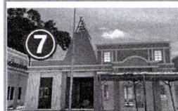
7 ขนาดพื้นที่ทั้งหมด 63.6 ตารางเมตร