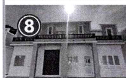
8 ขนาดพื้นที่ทั้งหมด 63.6 ตารางเมตร