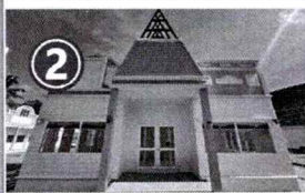
2 ขนาดพื้นที่ทั้งหมด 55.8 ตารางเมตร