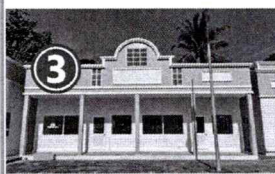
3 ขนาดพื้นที่ทั้งหมด 60 ตารางเมตร