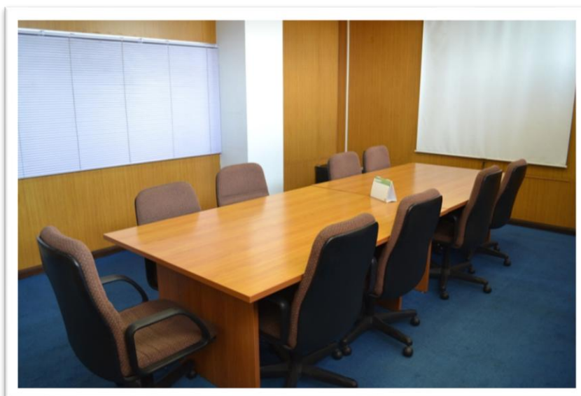
ภาพที่ ๒ ภายในห้องไม่คับแคบจนเกินไป ไม่มีสิ่งรบกวนสมาธิ