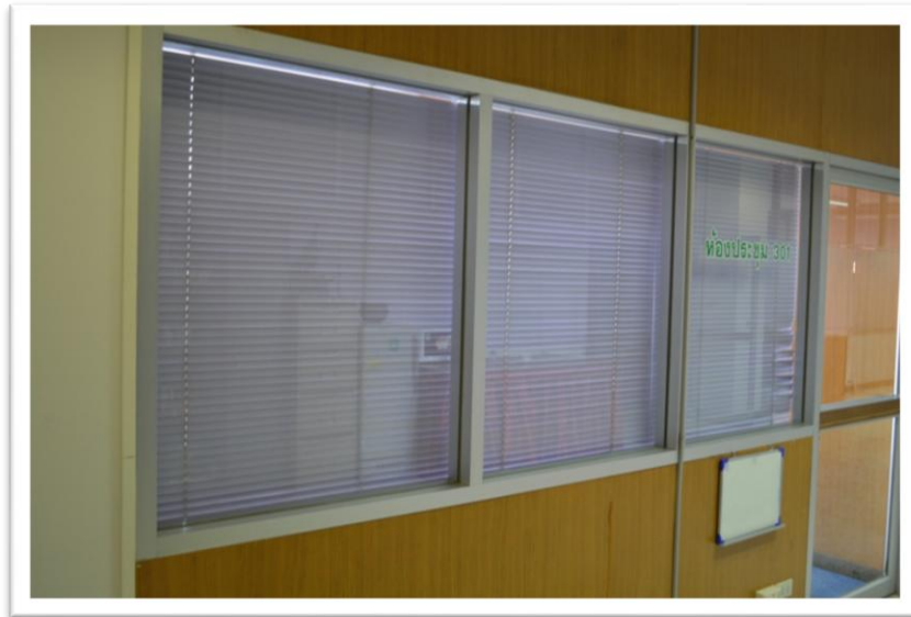
ภาพที่ ๑ ภายนอกที่มิดชิด ป้องกันมิให้บุคคลอื่นมองเห็นตลอดเข้าไปได้